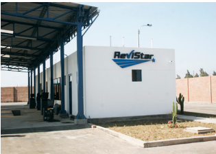
Opus första bilprovvningsanläggning i Ica, Peru. Koncernen kommer att vara verksam under namnet ReviStar och förväntar starta igång under tredje kvartalet