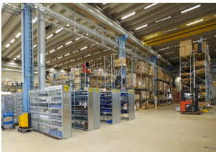
Opus Bimås lager i Mölndal