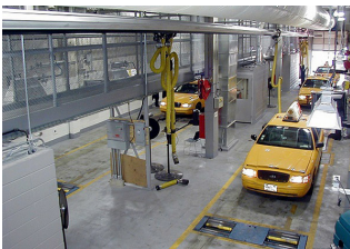
Bilprovvningsanläggningen hos New York City Taxi and Limousine Commission i Woodside, Queens