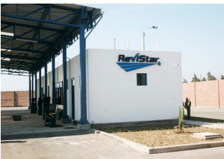
Opus första bilprovvningsanläggning i Ica, Peru, där koncernen är verksam under namnet ReviStar