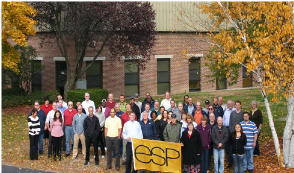
ESP Huvudkontoor i Hartford, Connecticut med anställda