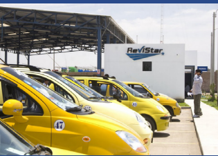
Opus första bilprovningensanläggning i Ica, Peru, där koncernen är verksam under namnet ReviStar