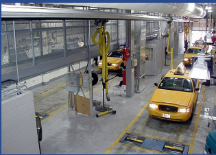
Bilprovningensanläggningen hos New York City Taxi and Limousine Commission i Woodside, Queens